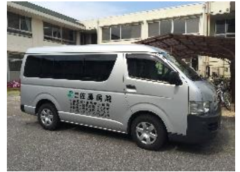
桑名駅東ロータリー